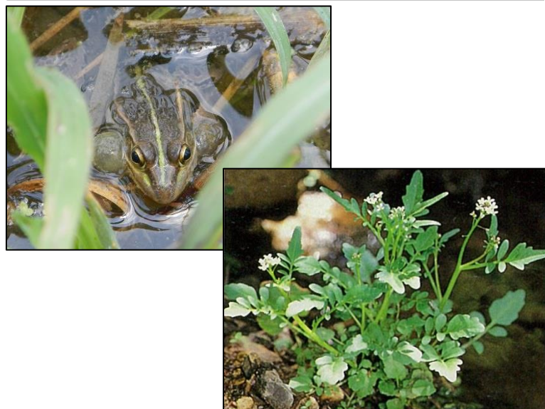
西条地区の湧き水で見られる希少な生き物 (左図:トノサマガエル、右図:オオバタネツケバナ(山溪ハンディ図鑑より))