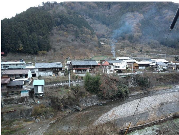
考察対象とした南牧村

行政区域 市区町村役場 医療施設 バス停留所(ポイント) 洪水浸水想定区域 土砂災害危険箇所